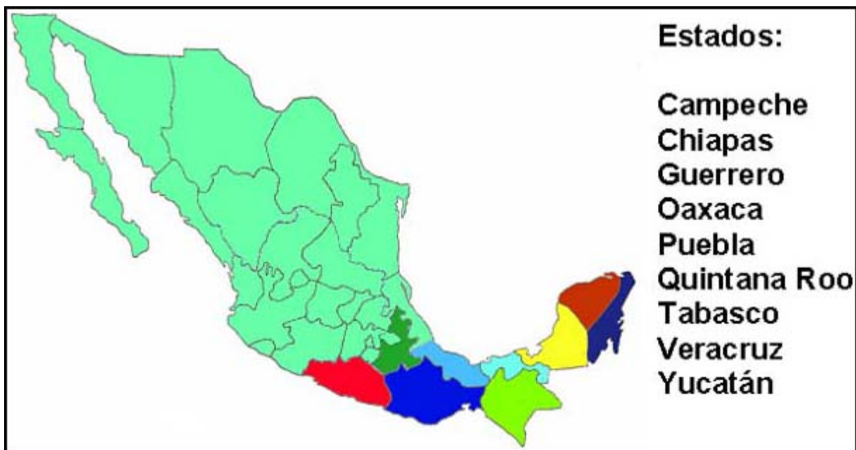
FIGURA 2: ESTADOS QUE COMPRENDE LA REGIÓN SUR-SURESTE DE LA REPÚBLICA MEXICANA